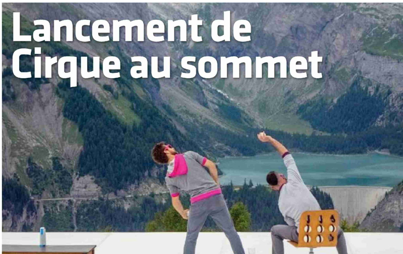
Une vue saisissante sur le barrage de Zeuzier, et un spectacle virtuose, drôle et tendre pour lancer le festival. MATHIAS BRISSONNAUD

CRANS-MONTANA | Le rendez-vous circassien a débuté ce mardi, dans le décor saisissant de l'alpage de Chetzeron avec Merci LaRatrape.